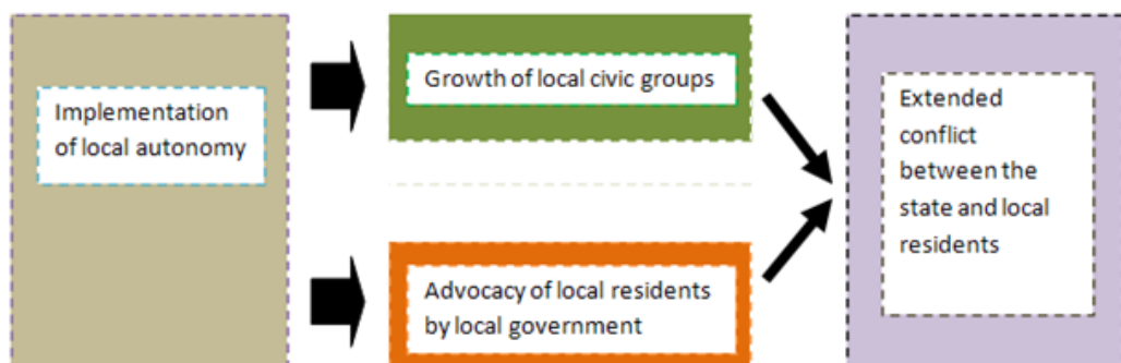
Figure 1.: The relationship between local autonomy and extended conflict