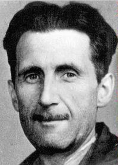
จอร์จ ออร์เวลล์ เป็นนามปากกา ของ เอริก อาร์เทอร์ แบลร์ นักเขียนชาวอังกฤษ 2446 - 2493