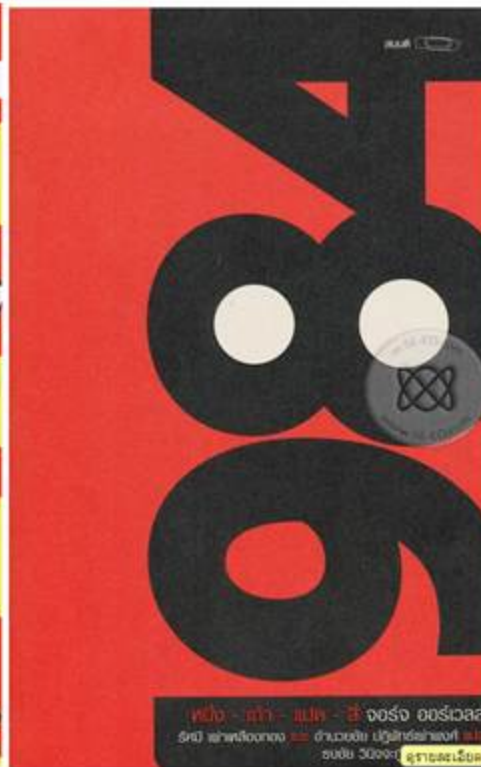
หนังสือ - นวนิยาย - เรื่องสั้น - จอร์จ ออร์เวลล์ 518 หน้า 144 หน้า 100 หน้า 100 หน้า 100 หน้า 100 หน้า ฉบับนี้ 30 บาท 24 บาท 24 บาท 24 บาท 24 บาท