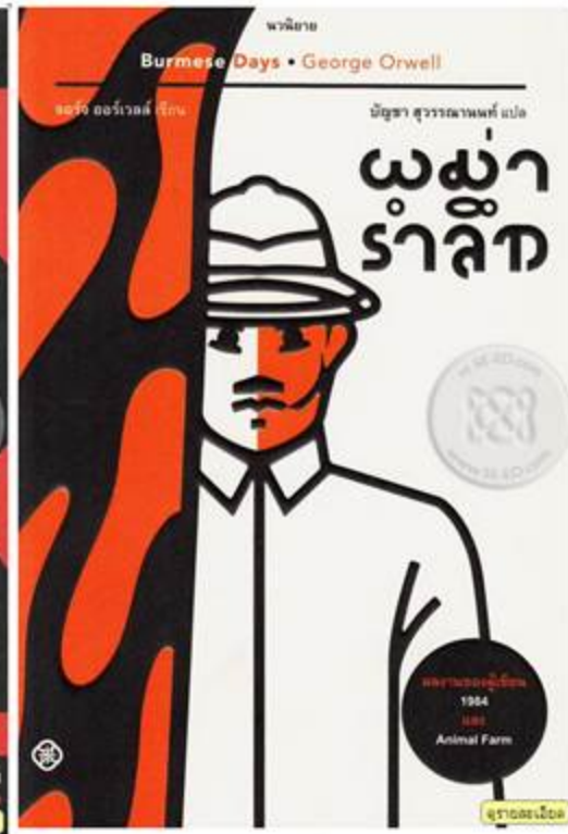
จอร์จ ออร์เวลล์