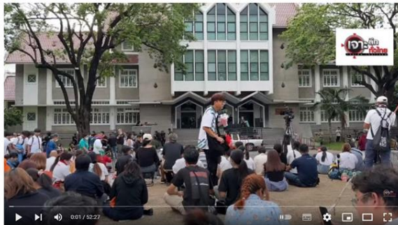
สด.มหาวิทยาลัยเกษตรศาสตร์ บรรณกาศการจัดชุมนุมไล่ สว.

ไม่ได้เป็นเรื่องของสมบัติ งามบุญอนงค์ แต่เป็นตัวแทนของประชาชนคนพลเมืองอื่นๆ ที่จะทยอยเปิดตัวตามมา